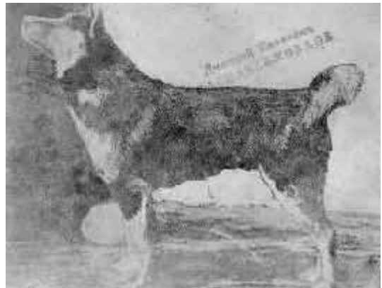
6. Зыряно-остяцкая лайка

Есть указание, что в крови финских лаек имеется кровь карельской лайки. Когда-то на обширной территории Карелии вероятно существовала одна порода лаек, но под влиянием времени порода эта постепенно расщеплялась до образования двух отдельных, близко родственных между собой видов. В настоящее время Финляндия имеет свой стандарт финской лайки и считает ее чистым видом. В названной статье указывается, что в конце прошлого столетия эта единственная финская порода охотничьих собак была взята под покровительство только что основанным финляндским „клубом породистых собак" (Кенель- клубом).