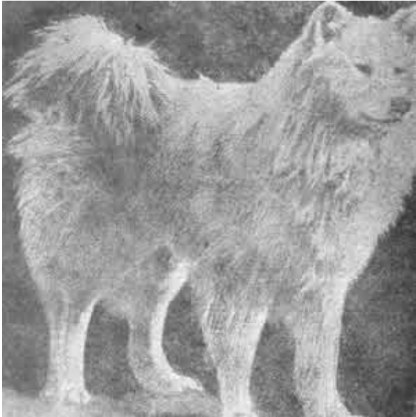
1. Самоедская лайка