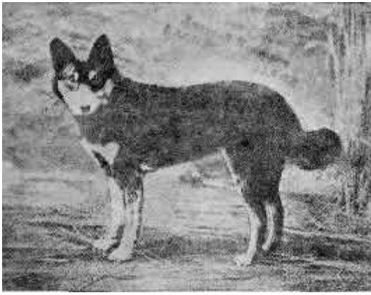
3. Зырянская лайка (сука)