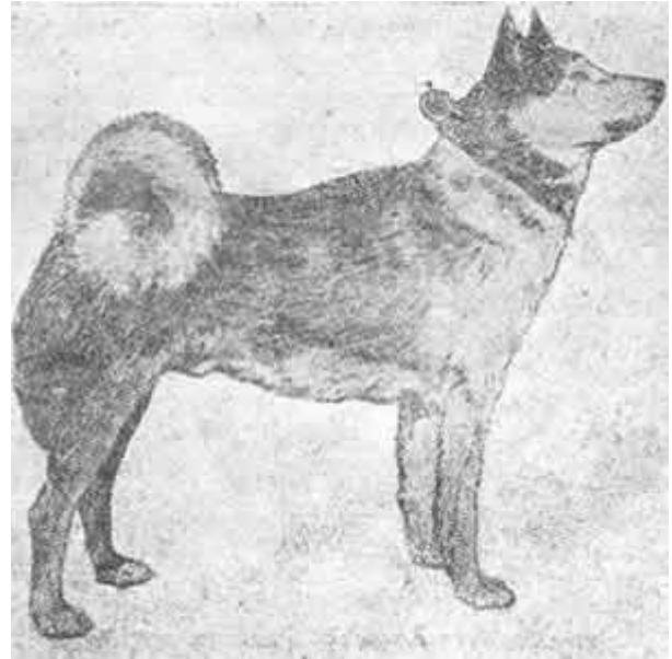
2. Карело - зырянская лайка

Нужен ли нам сейчас стандарт на каждую отдельную разновидность лаек? Я думаю, что этого нам не нужно, и пользы от этого не будет. Объехав значительные районы Северного края, побывав в области Коми в Устькуломском и в Троицко - Печорском районах, я перевидел сотни зырянских лаек, перемерил десятки лучших собак и должен сказать, что этот вид лайки имеет мало отличий от лучших лаек Карелии. Значительна разница между этими двумя разновидностями в головах: у зырянской лайки голова суше, черепная коробка и расстояние между ушами уже, само ухо выше и острее, чем у карельской лайки. Зырянская лайка „подрывиста", борзовата, а карельская с меньшим подрывом, с более тяжеловатой колодкой и на более низких ногах. В остальном они настолько сходятся, что почти не имеют отличий. Основной окрас зырянских лаек серый, разнообразных оттенков, затем черный, лисоподобный и пегий. По моим наблюдениям, черные лайки вообще хуже серых и страдают серьезным недостатком — светлоглазостью, чего у лаек серого окраса я не наблюдал; пегие окрасы встречаются сравнительно часто и больше — черно-пегие и серо-пегие, полово-пегих я почти не видел.