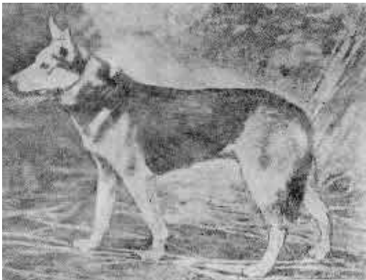
5. Зырянская лайка (сука)

Для Северного края наиболее затушевана карельская лайка. Эта разновидность еще не так давно водилась по всей северной и средней частям Архангельской губернии, но в связи с быстрым заселением района, проведением железнодорожной линии, с появлением массы разнообразных дворняг (из средних районов Союза) карельская лайка выродилась в лайкообразную форму дворняжки и частью поглотилась более устойчивой кровью зырянской лайки. В Карелии этот вид лайки отчасти еще сохранился в достаточной чистоте. Ширинский-Шихматов в своих трудах о лайке указал на примесь финской крови в карельской лайке и назвал ее „финно-карельской лайкой". (в статье „Финская лайка", журнал „Охотник" 1929 г. № 5.)