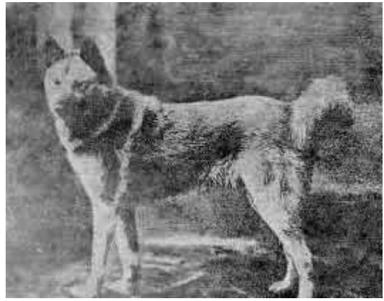
4. Зырянская лайка (кобель)

К сожалению, полевые качества зырянской лайки значительно снизились, если только не упали совсем. Это видно хотя бы из того, что найти хорошую духовую лайку-мелочницу, чующую самого зверя, трудно, еще более трудно найти зырянскую лайку-медвежатницу. С лайкой промышленник Коми бьет только белку и изредка куницу, а весь остальной зверь добывается им самоловами.