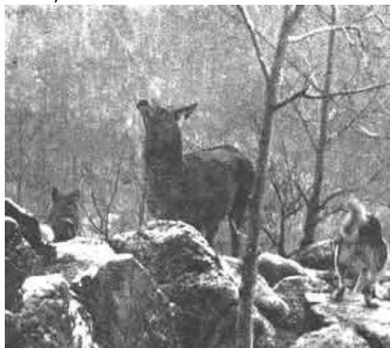
Лайки удерживают изюбря на "отстое"

Условия, при которых наиболее производительно может работать собака, ограничены. Поэтому охоту с ней нельзя расценивать как единственную, наиболее производительную при любых условиях.