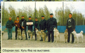
Сборная пос. Куть-Яха на выставке.