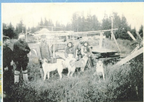
Тажские аборигены со своими лайками (конец XIX века).