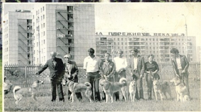
На выставке в г. Тюмени. 1983 г.