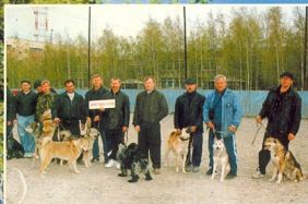
Сборная Нефтеюганской секции ОС.