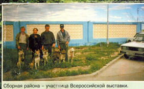
Сборная района – участница Всероссийской выставки.