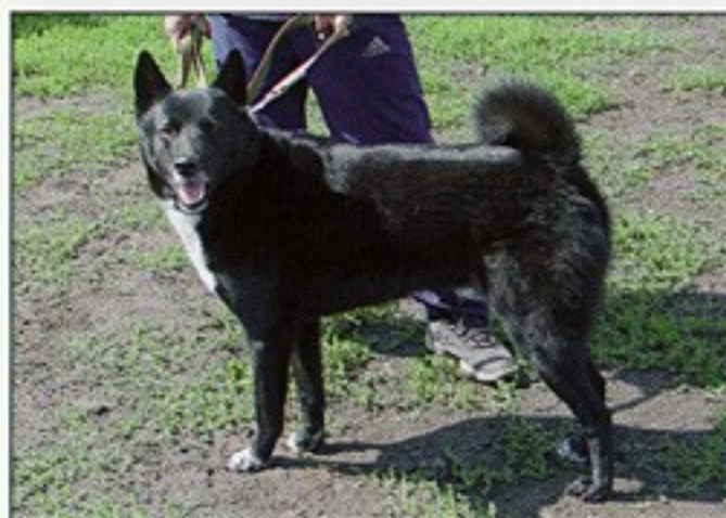
Улькан, Св.143/99 вл. Янов А.А., Иркутск