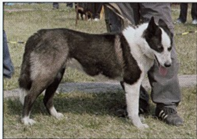
Кристина Св. №102/07 - вл. Пак Кан Ву, Иркутск