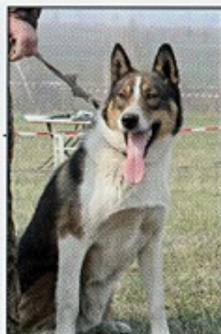
Жулик II, Св. № 07/03, вл. Максимов С.С., Иркутск