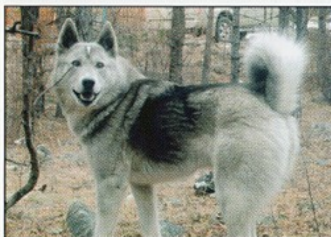
Бугор, Св. № 281/02, вл. Казаков В.И., Иркутск