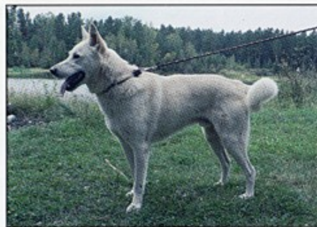
Белый 1706/06, вл. Борхолоев В.В., Иркутск