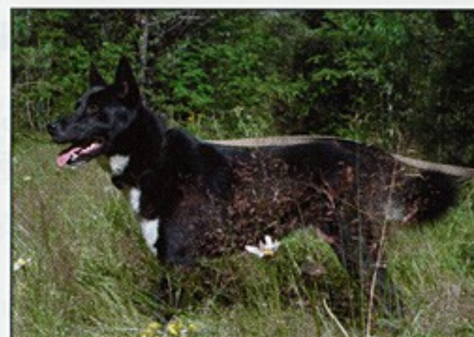
Умка 1769/07, вл. Плотников В.Г., Иркутск